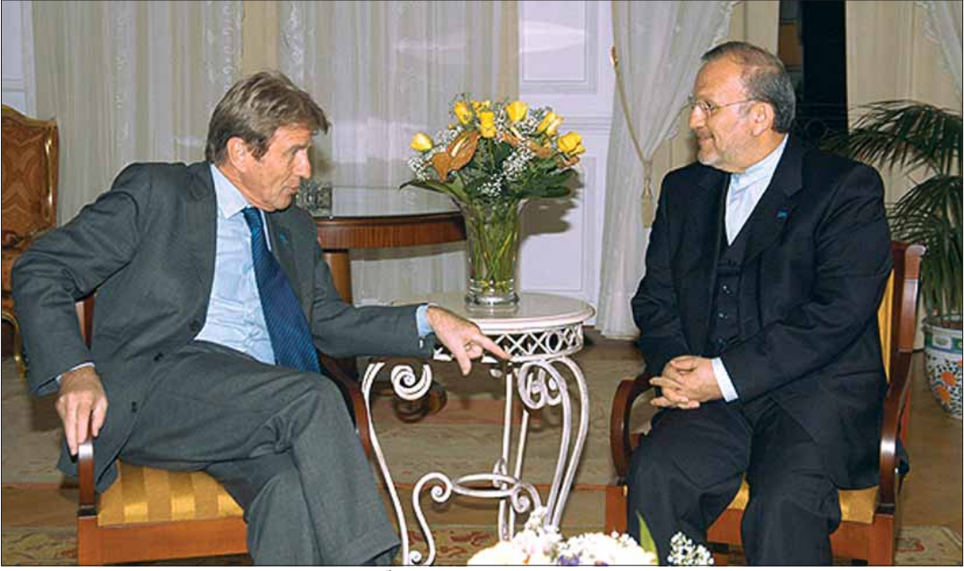
برنار کوشر در تماس تلفنی با منوچهر متکی از وی خواسته است در جهت قانع کردن حماس به پذیرش آتش‌بس و اجرایی کردن قطعنامه ۱۸۶۰ کمک کند

گفت‌وگو درباره راه‌های کمک به ملت فلسطین در برابر حملات اسرائیل پرداخت. حمید بهبهانی وزیر راه و ترابری هم در سفری جداگانه راهی مالزی شد تا پیام احمدی نژاد را تسلیم نخست‌وزیر این کشور کند. وی دیروز همچنین در دیداری جداگانه با وزیر خارجه مالزی مواضع ایران را درباره موضوعات دوجانبه، منطقه‌یی، فلسطین و غزه تشریح کرد.